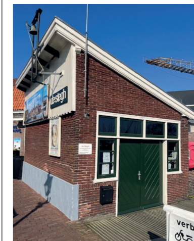
De Stegh met de Haringklok in top