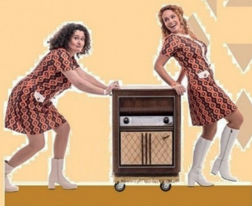
DE MEISJES VAN DE RADIO

Stichting Gecoördineerd Ouderenwerk Monnickendam